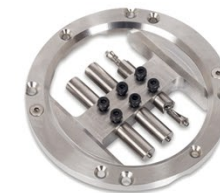
COMING SOON Titan Abutments